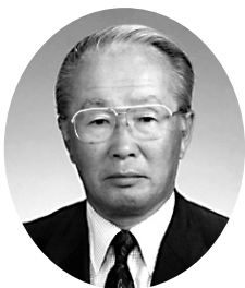
会 頭 島 一