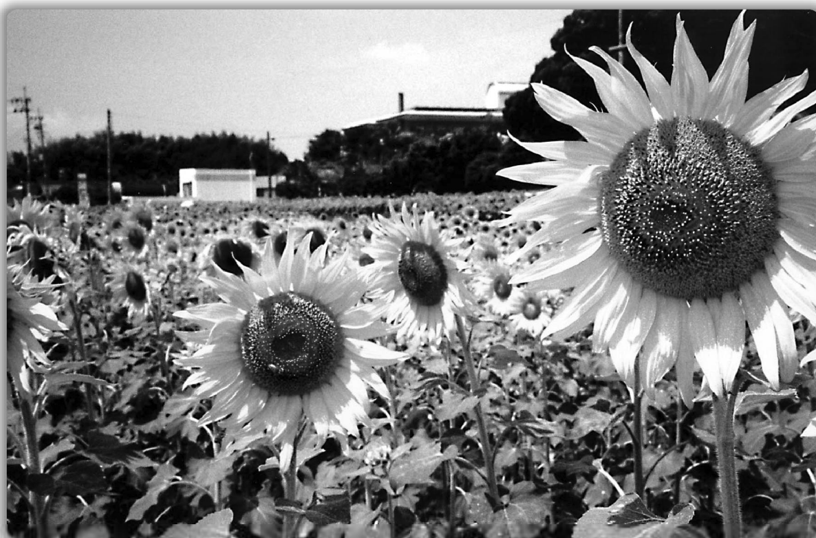
「夏本番、輝く太陽に向かって」藤川 敏 江作品

http://www.kan-cci.or.jp/ E-mail: info@kan-cci.or.jp/