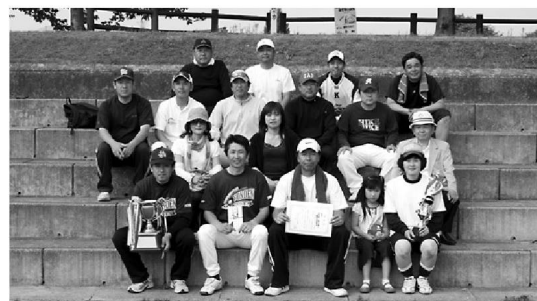
四国電力(株)観音寺営業所